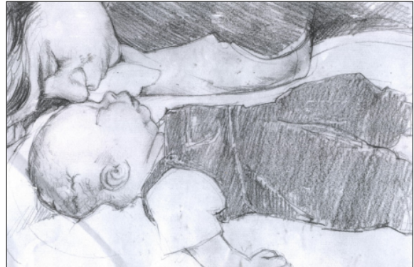
Tegning af Heather Spears

I mange hundrede år var seksualiteten og det kristne ægteskab tæt knyttet til hinanden, og indtil det 19. århundrede var udøvelse af seksualiteten uden for de givne rammer ikke blot en synd, men en kriminel handling. Hvis to ugifte personer fik et barn sammen, blev det kaldt "lejermål", og loven forskrev både en gejstlig straf i form af et offentligt skriftemål i kirken og en verdslig straf i form af skyhøje bøder for forseelsen.